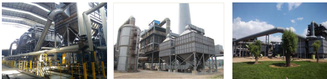
喷淋电除雾机等离子净化系统

(2) 针对延用喷浆造粒技术资源化利用废水时产生的烟气问题，公司开发了“文丘里除尘—喷淋降温—汽液换热—电除雾—等离子”组合工艺；从制肥配料工艺着手进行低温造粒，从源头大幅度削减造粒烟气及焦糊味。通过以上措施，在行业内率先突破了制约行业发展的瓶颈，首创彻底解决了谷氨酸行业烟气治理这一世界性难题。